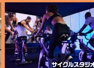
サイクルスタジオ

話題のトランポリンプログラムや、全世界で人気のレズミルズプログラムなど、夢中になれるレッスンを毎日たくさん実施中!