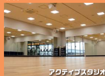
アクティブスタジオ

話題のトランポリンプログラムや、全世界で人気のレズミルズプログラムなど、夢中になれるレッスンを毎日たくさん実施中!