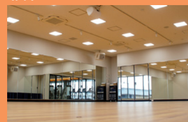
アクティブスタジオ

話題のトランポリンプログラムや、全世界で人気のレズミルズプログラムなど、夢中になれるレッスンを毎日たくさん実施中!